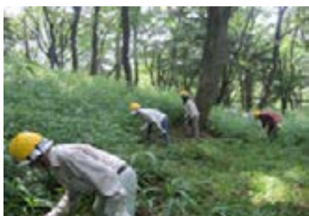
スキルアップ研修（植生復元を目的とした草刈）

そのような中で、近年市民による森づくり活動が活発に行われており、そのサポートとして、横浜市では「横浜市森づくりボランティア団体育成・支援要綱」に基づき、市民の森や都市公園等で活動する団体に対して、道具の貸出や研修の実施、アドバイザー派遣などの支援を行っています。団体のスキルアップを目的とした研修では、平成 22 年度は、草刈や伐採等の森づくり作業における安全管理や、竹林管理作業の基礎、生物多様性を高めるための管理作業などをテーマに行いました。