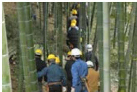
スキルアップ研修（竹林管理作業）

横浜のような都市では森は市民生活に近接して存在し、土地所有者、森づくり活動をする人、自然観察をする人、ウォーキングやランニングにくる人など、多くの人が様々な形と思い関わっています。都市にある森のあり方は、周辺住民や利用する市民にとっての安全性や快適性、また