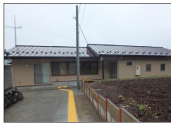
上古沢老人憩いの家

そのため、山から丸太を出すことへの支援の他、製材工場に必要な木材加工機械の整備への支援を行うとともに、県産木材を使用した木造公共施設の整備などへも支援をしています。