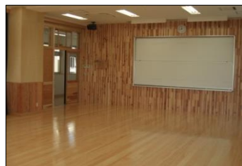
福沢小学校（壁面、床）

開始当初から 10 年が過ぎ、今では県内 25 市町村に 72 施設が整備されています。