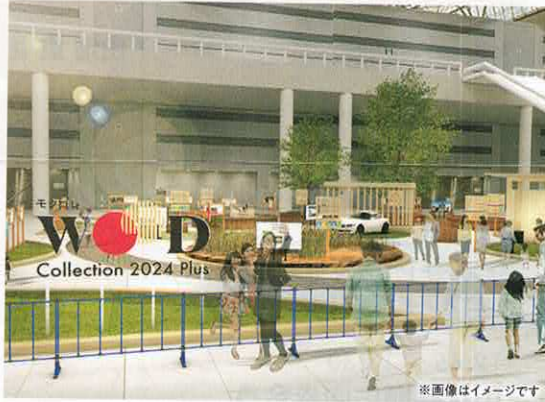
※画像はイメージです

「植える、育てる、収穫する、使う」それぞれのシーンの中で、林業に関する4つのキーワード「林業イノベーション」「スマート林業」「ウッドチェンジ」「木質バイオマス」から最新の事例をピックアップ、緑あふれる公園をイメージした開放的な空間の中で展示・紹介します。