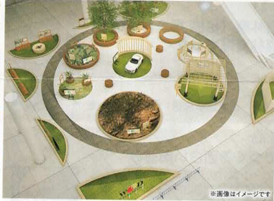
※画像はイメージです