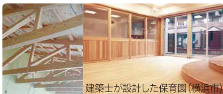
建築士が設計した保育園(横浜市)