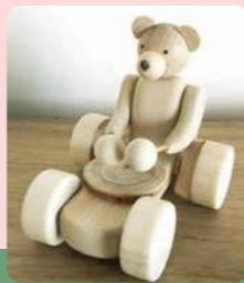
木のぬくもりを感じる木工作品