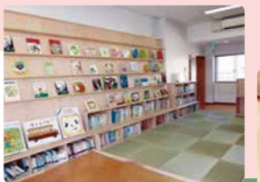
空間の木質化とワークショップ