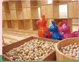
←チルドリンカフェ@南青山山参道