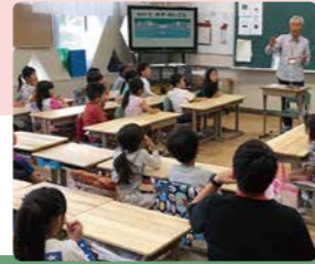
←天板交換時に行う環境授業 ↓児童機の天板「森の机」