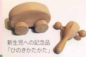
新生児への記念品「ひのきかたかた」