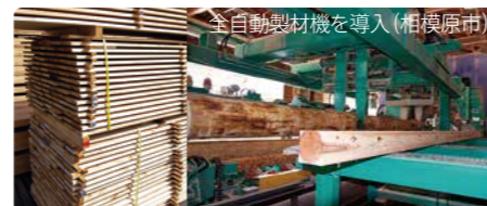
全自動製材機を導入(相模原市)