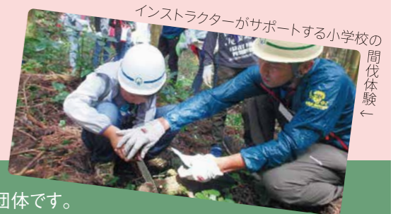
インストラクターがサポートする小学校の間伐体験←

森林整備などの指導者として県知事の認定を受けた森林インストラクターで構成する団体です。森林ボランティア活動の指導や、自治体や企業の要請に応じて、環境学習やイベントの支援を行っています。