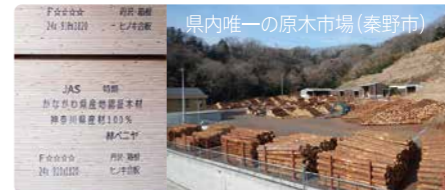
↑県産木材で製造した針葉樹合板

県内にある10森林組合を会員とし、県内唯一の原木市場を開発しています。定期的に木材市を開催するほか、提携合板工場でつくられた針葉樹合板や杭・チップなどの加工品を販売するとともに「かながわ森林・林業活性化協議会」の事務局として、木材の産地や品質の証明を行っています。