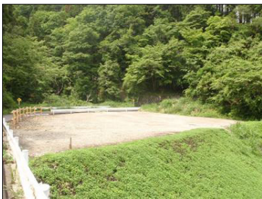
三廻部林道作業ヤード

神縄線、箱根町宮城野の宮城野線において、新設に取り組んでまいります。このうち、八丁神縄線については、平成26年度で事業が完了する予定です。